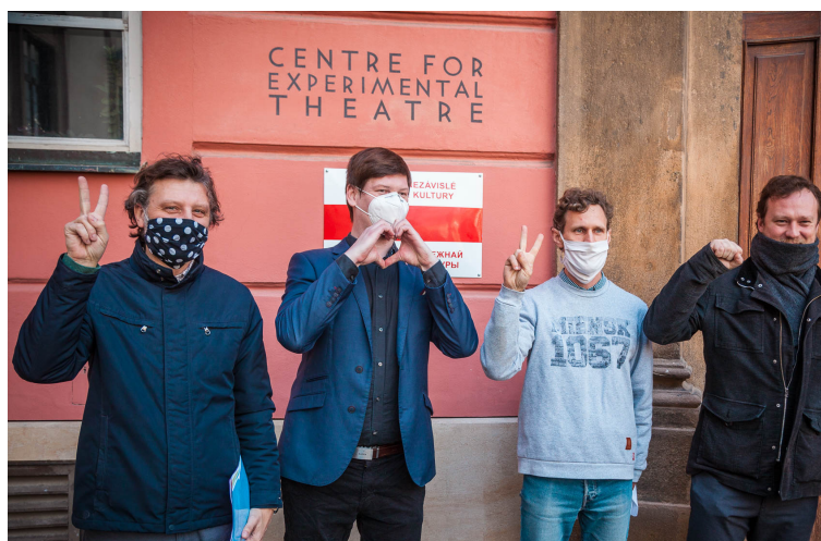
symbolické otevření Ambasády nezávislé běloruské kultury v ČR

„Smyslem zřízení ambasády je propagace nezávislé běloruské kultury, jež je v současné době v Bělorusku potlačována. Nejedná se přitom o politický formát, nýbrž o kulturní projekt zaměřený na nezávislou a svobodnou běloruskou kulturu a její projevy v celé její šíři a rozmanitosti. „Nejsme politici, jsme umělci. Věříme však v sílu kultury a v její schopnost získat lidi pro dobrou věc,“ dodává ředitel Oščatka.