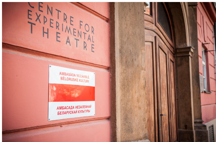
Sídlo Ambasády běloruské nezávislé kultury v na Zelném trhu 9 v Brně.

„Smyslem zřízení ambasády je propagace nezávislé běloruské kultury, jež je v současné době v Bělorusku potlačována. Nejedná se přitom o politický formát, nýbrž o kulturní projekt zaměřený na nezávislou a svobodnou běloruskou kulturu a její projevy v celé její šíři a rozmanitosti. „Nejsme politici, jsme umělci. Věříme však v sílu kultury a v její schopnost získat lidi pro dobrou věc,“ dodává ředitel Oščatka.