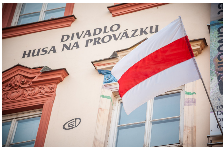
Běloruská vlajka v Brně na budově Divadla Husa na provázku / Centra experimentálního divadla

Ve čtvrtek 25. března uplyne 103 let od vyhlášení novodobého běloruského státu – Běloruské lidové republiky. Kvůli nástupu sovětů nevydržela existence nezávislého státu dlouho. V době před Lukašenkem byl tento den běloruským státním svátkem, za jeho éry se proměnil v den zahájení protestní sezony. Také letos jsou na tento den plánovány pouliční protestní akce. Očekává se, že Lukašenkův režim se proti pokojným demonstrantům pokusí tvrdě zakročit.